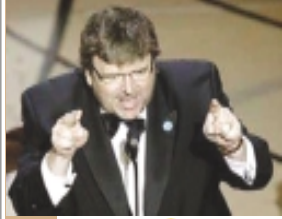
مایکل مور سینماگر آمریکایی در روز ۲۲ مارس و در هنگام گرفتن جایزه اسکار در جلوی چشم میلیون‌ها نفر بیننده تلویزیونی انتخابات ریاست جمهوری بوش را تقلبی خواند و خطاب به وی گفت: «بوش! خجالت بکش»