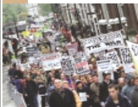
تظاهرات دوستان هزار نفری در شهر سان فرانسیسکو (۱۶ فوریه ۲۰۰۳)