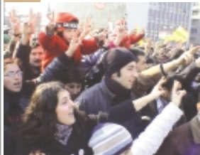
تظاهرات ده‌ها هزار نفری مردم در آنکارا، ترکیه. چند ساعت بعد از این تظاهرات قرار بود اعضای پارلمان ترکیه برای تصمیم‌گیری در مورد اجازه دادن به آمریکا برای استفاده از خاک ترکیه در حمله به عراق تشکیل جلسه بدهد. (۲۱ مارس ۲۰۰۳)