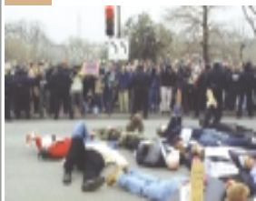
تظاهر کنندگان ضد جنگ در یکی از خیابان‌های شهر واشنگتن روی زمین خوابیده‌اند. در این تظاهرات پلیس چند ده نفر را بازداشت کرد. (۲۱ مارس ۲۰۰۳)