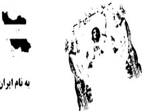
به نام ایران